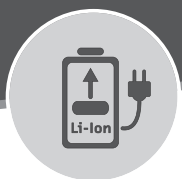
CORD/CORDLESS OPERATION 75 min use 45 min charge