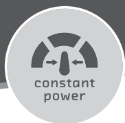
CONSTANT CUTTING POWER